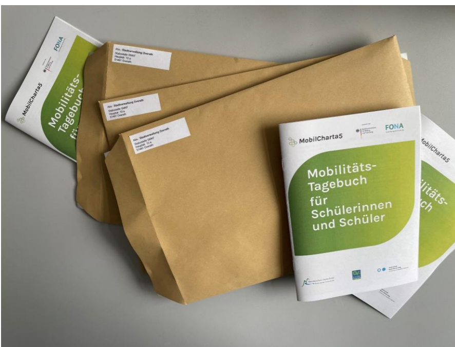
Tagebücher der Mobilitätstagebuch-Studie mit Kindern/Jugendlichen und deren Eltern